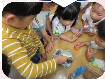
⑥ 石けんの粉を50g量る