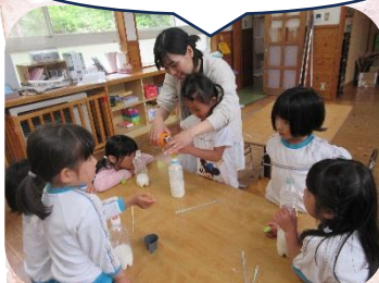
② EM液をキャップ2杯入れる