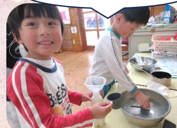
③ めるま湯をペットボトルいっぱい入れる