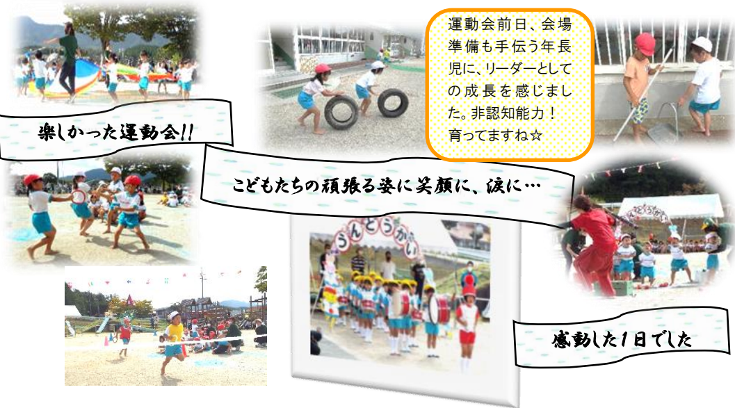
楽しかった運動会!!

ひとりではできないことでも、ふたりでならできる。二人で出来ないことでも、大勢ならできる。みんなで助け合うことによって、思いもかけない大きな仕事ができることをわからせよう。